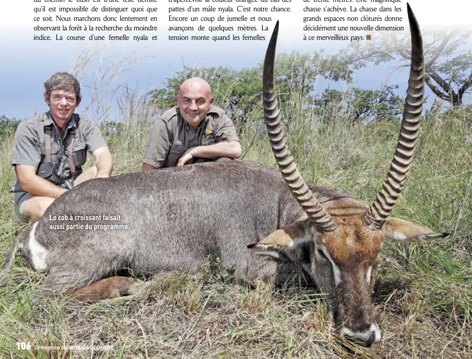
Le cob à croissant faisait aussi partie du programme.