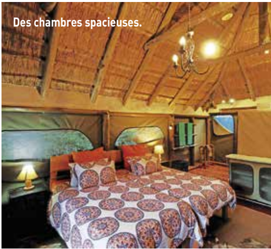
Des chambres spacieuses.