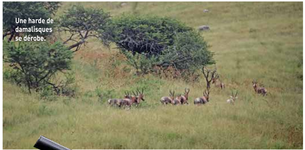
Une harde de damalisques se dérobe.