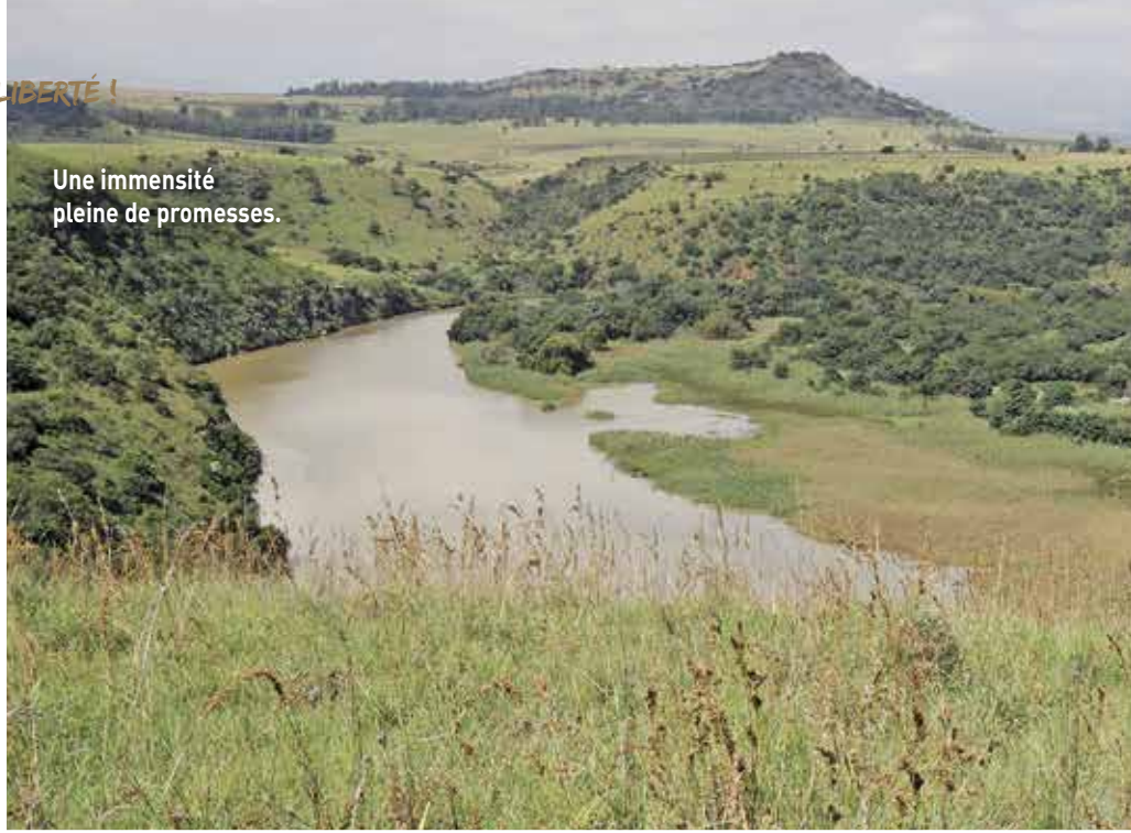
Une immensité pleine de promesses.